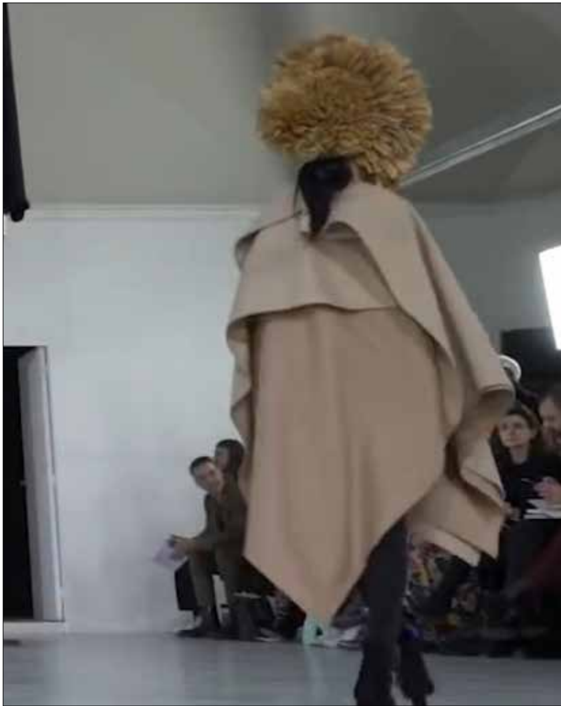
Videostill uit modeshow