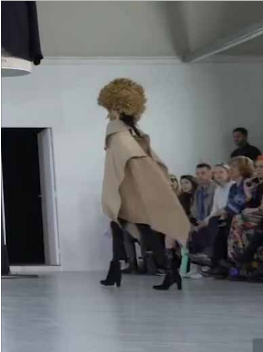
Videostill uit modeshow